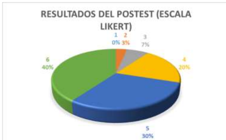
Figura 2. Resultados del postest. 2

En el pretest, los resultados evidencian una mayor concentración de respuestas en los niveles bajos y medios de la escala, particularmente en las categorías “en desacuerdo”, “en desacuerdo más que de acuerdo” y “neutral”. Esto indica que, antes de la aplicación de GeoGebra, los estudiantes presentaban dificultades en la comprensión de las funciones cuadráticas, así como una percepción limitada respecto a su propio aprendizaje.