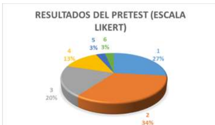
Figura 1. Resultados del pretest. 1

Con el propósito de analizar la percepción de los estudiantes sobre la comprensión de las funciones cuadráticas, se aplicó una encuesta tipo Likert antes (pretest) y después (postest) de la intervención con el software GeoGebra.